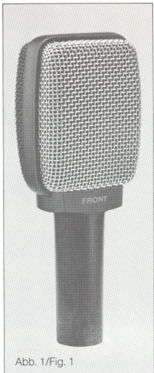
Abb. 1/Fig. 1