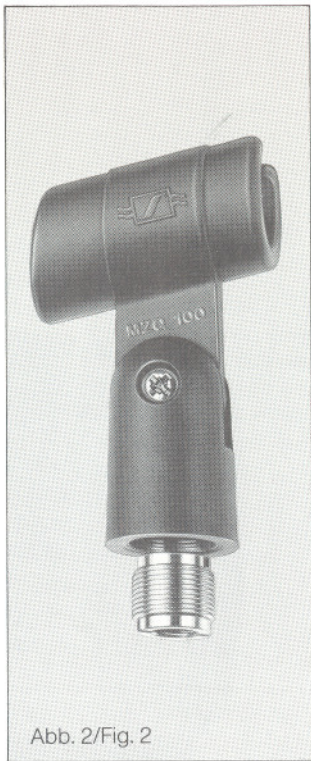
Abb. 2/Fig. 2